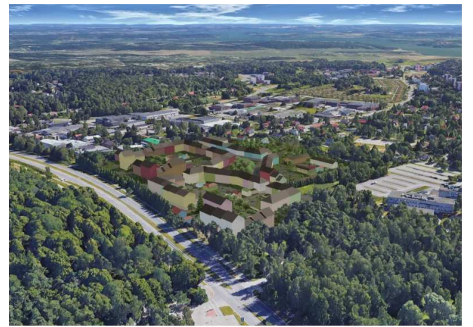
HAVAINNEKUVA KAUPUNKIYMPÄRISTÖ / TITO TUNNELA