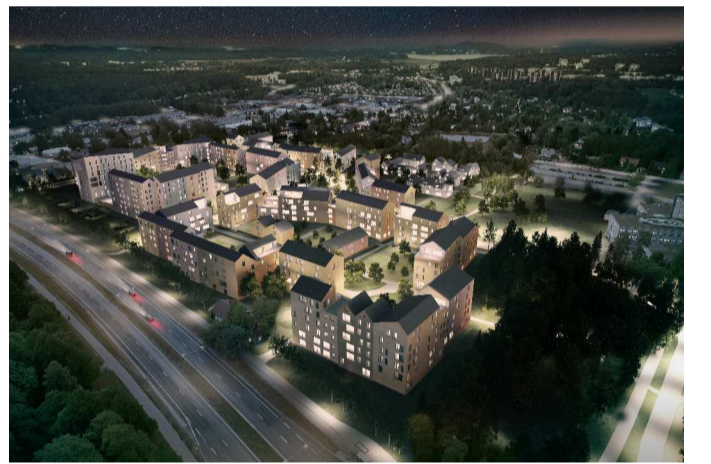
HAVAINNEKUVA UUDENMAANTIETÄ, ARKKITEHDIT MY OY