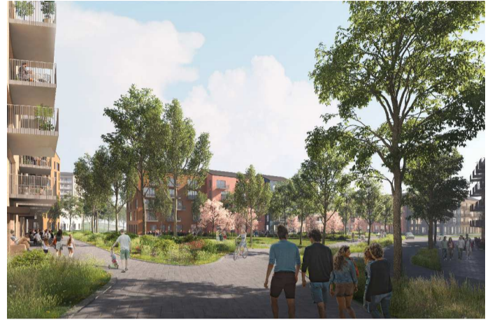
HAVAINNEKUVA HELLEMAANUKIOLTA, ARKKITEHDIT MY OY